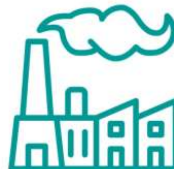
Výroba a výzkum